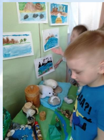
Ребята с интересом рассматривают выставку «Наш Байкал»