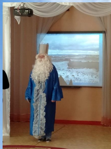
В гости пришел батюшка БАЙКАЛ