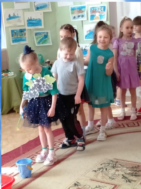
Игра «Очистители воды»